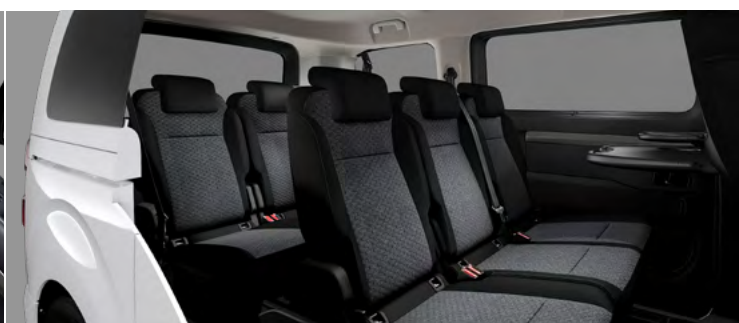
SPACETOURER BUSINESS + PACK FAMILY