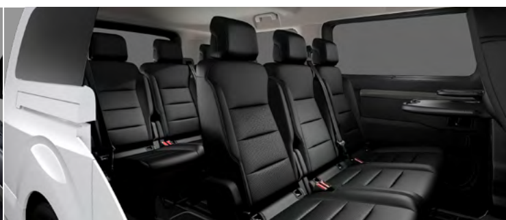
SPACETOURER BUSINESS LOUNGE